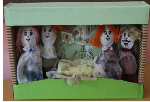
Театр на ложках2