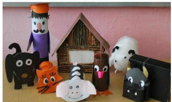
Театр на втулках