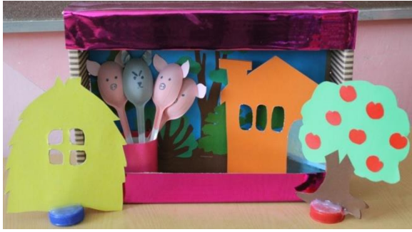
Театр на ложках1