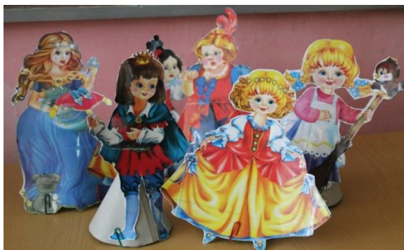
Театр на конусах