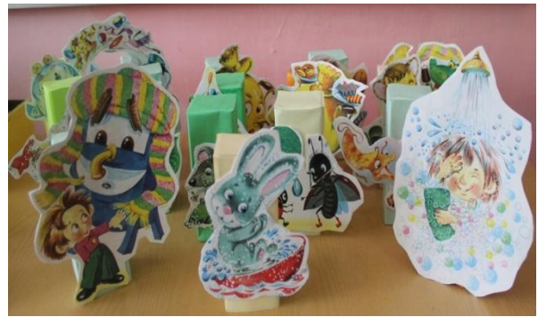
Театр на коробках