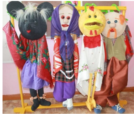
Театр на платках